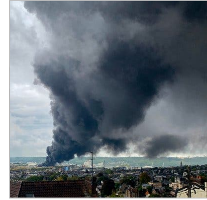
对社区健康的影响