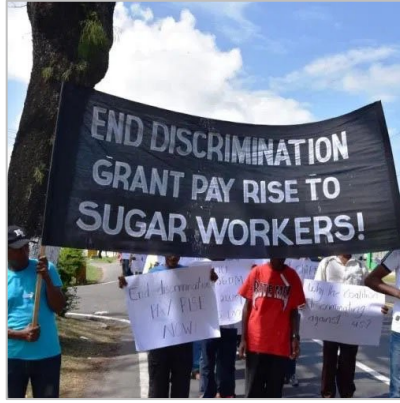
低于消费水平的工资